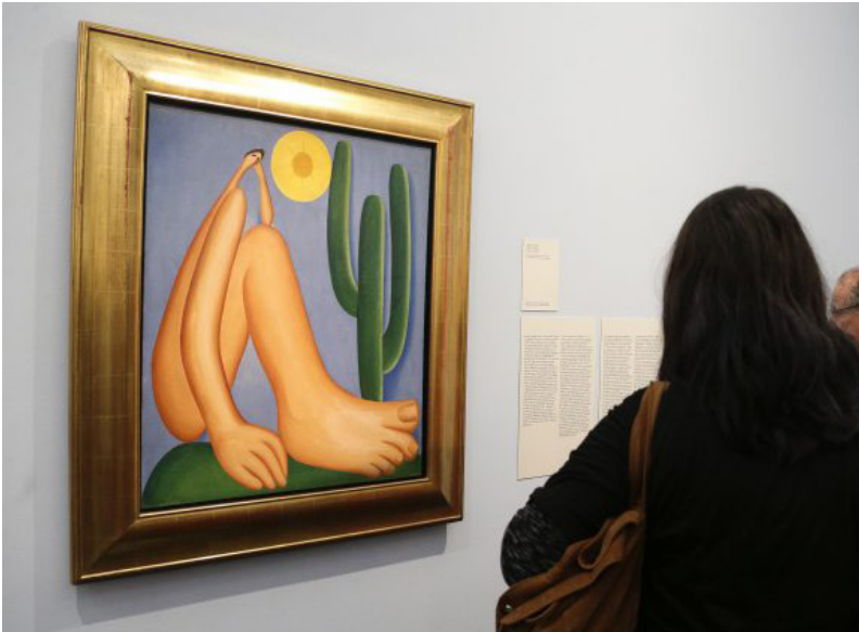
Figura 1. Exposição Tarsila Popular

Fuente: Abaporu 1928. Museu de Arte de São Paulo (Masp). Foto destacada de Marcos Santos/USP Imagens (2019). 2