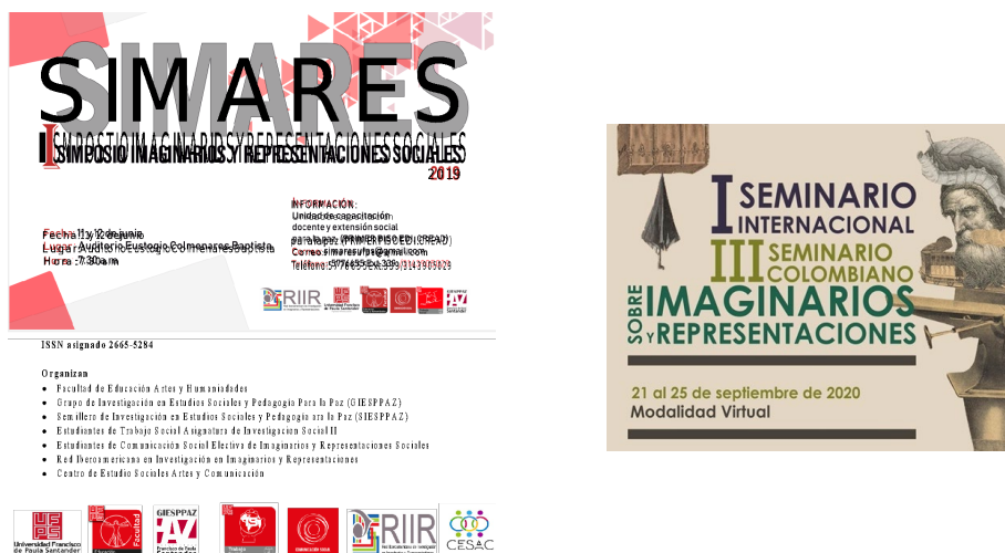
Figura 2. Eventos relacionados con Imaginarios y Representaciones Sociales

situada: Construcción de teoría en/sobre la Escuela desde los Imaginarios Sociales. Participaron en el evento investigadores, profesores de enseñanza básica y superior, estudiantes de postgrado y miembros de organizaciones de la sociedad civil (Figura 2).