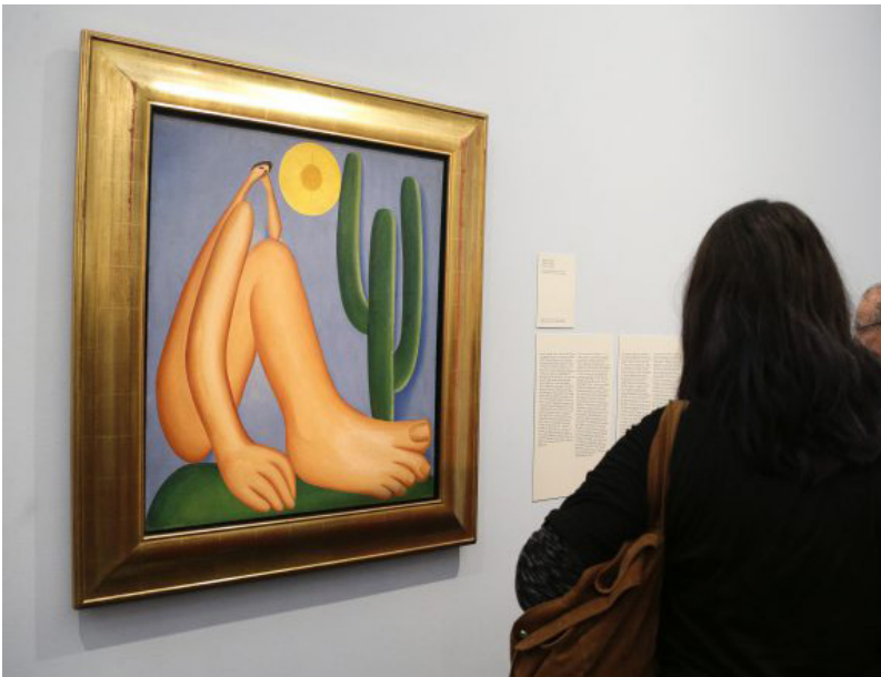
Figura 1. Exposição Tarsila Popular

Fonte: Abaporu 1928. Museu de Arte de São Paulo (Masp). Destaque da foto de Marcos Santos/USP Imagens (2019). 2