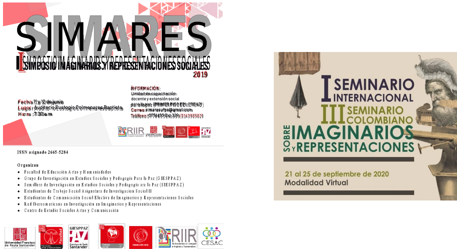
Figura 2. Eventos relacionados com imaginários e representações sociais